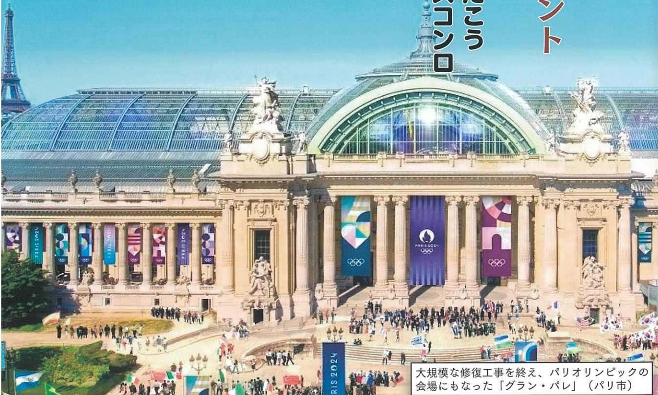
大規模な修復工事を終え、パリオリンピックの会場にもなった「グラン・パレ」（パリ市）

創立15周年の消費者庁の実績と課題 給湯器の点検商法によるトラブル増加 労働問題から見るカスタマーハラスメント ほぼ完全栄養食品のたまごおいしくパワーをいただこう 「料理ができる人はカッコいい」をサポートするガスコンロ