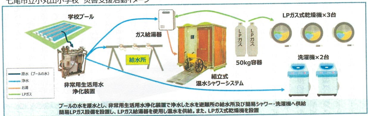
七尾市立小丸山小学校 災害支援活動イメージ

確かに期間の短い避難所生活であれば、飲み水や煮炊き用にペットボトルの水で充分なのだろうが、避難所生活が数ヶ月に及ぶ時には水不足で手洗いやシャワーを浴びることができないのはかなりのストレスになる。そのままでは使えないプールや川などの水を浄水してさまざまな用途に使う。こういう取り組みは是非必要だろう。また、災害時にいろいろな業種の事業者が速やかにコラボすることで人々の要望に応えようとする努力には敬意を表したい。