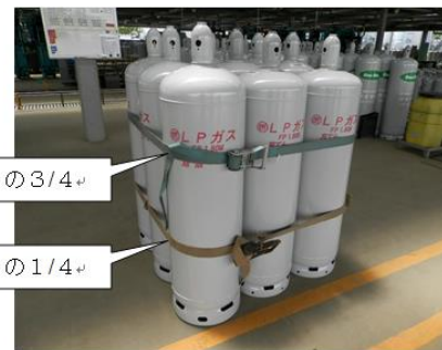
ラッシングベルトによる固定（例）