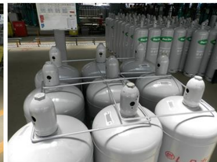
角リングによる固定（例）