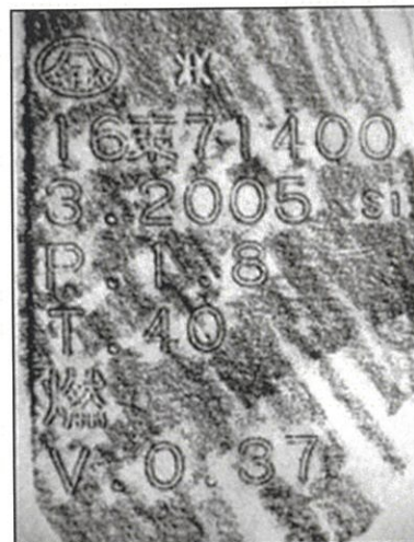
C. A 又は B の拓本