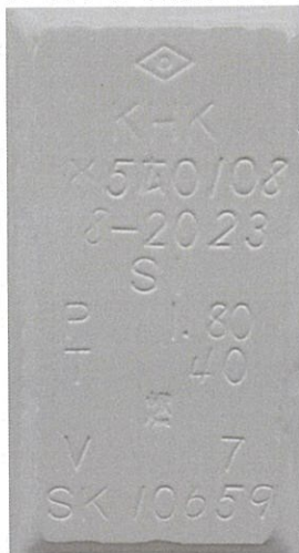
B. 「溶接された銘板による表示」の写真