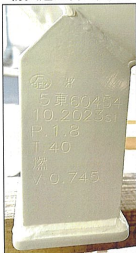
A. 「打刻による表示」の写真